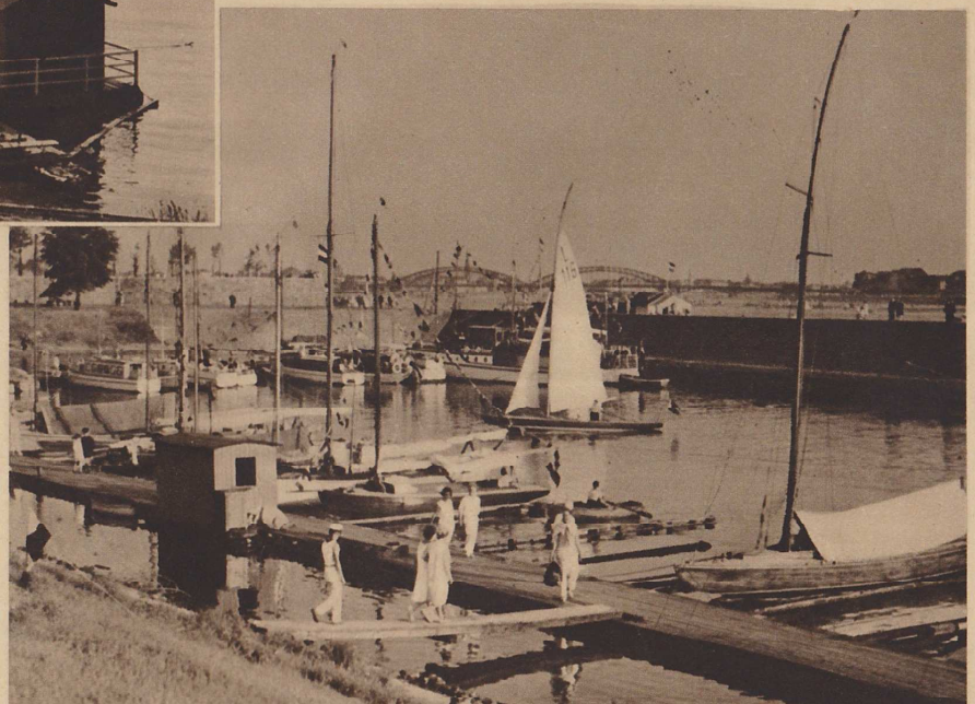
Sommerliches Leben im Düsseldorfer Jachthafen

Rhein. Und es gibt wirklich nichts Schöneres: Der Wind bläht die weiße Leinwand, man ist ganz fern von allen Menschen, mitten auf dem Strom, drüben grüßen die Weiten des Niederrheins. Ein fröhliches ahoi fliegt zu den Kameraden, die mit vollen Segeln im Sportboot uns überholen. Das sind dann auch die köstlichsten Bilder am Düsseldorfer Ufer, der Jachthafen mit seinen Motorbooten und schlanken Jachten, die Parade der Segel und der Boote, und die feinen Stimmungen überm Wasser, wenn die Sonne mit goldenem Abschiedsgruß die Wellen küßt.