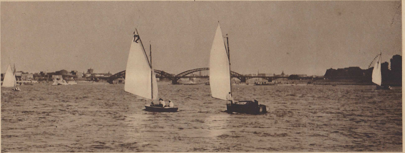
Im freien Wasser vor dem Wind

Wenn man jetzt einem Wassersportler, einem von denen, die Eigner eines der weißen Segel sind, fragt, ob er denn nicht in die Ferien geht, dann lächelt er uns mit einem Bedauern im Blick an. Was verstehen wir Landratten auch davon, selbst wenn wir immer so viel Freude über das bewegte Leben auf dem Rhein haben! Wenn man aber einen Sonntag oder gar ein Wochenende auf einem Segelboot verbracht hat, dann weiß man, daß diese Leute gar nichts anderes mehr haben wollen als ihr Boot, ihre weißen Segel, ihre Freuden auf dem