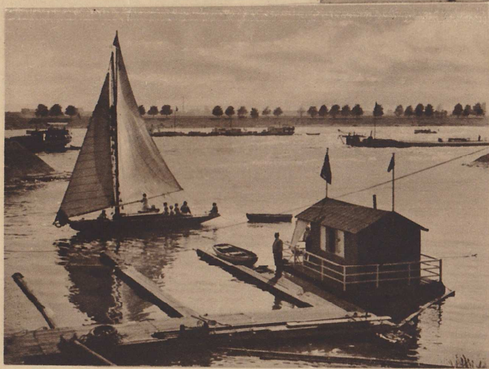
Abend am Rhein

Rhein. Und es gibt wirklich nichts Schöneres: Der Wind bläht die weiße Leinwand, man ist ganz fern von allen Menschen, mitten auf dem Strom, drüben grüßen die Weiten des Niederrheins. Ein fröhliches ahoi fliegt zu den Kameraden, die mit vollen Segeln im Sportboot uns überholen. Das sind dann auch die köstlichsten Bilder am Düsseldorfer Ufer, der Jachthafen mit seinen Motorbooten und schlanken Jachten, die Parade der Segel und der Boote, und die feinen Stimmungen überm Wasser, wenn die Sonne mit goldenem Abschiedsgruß die Wellen küßt.